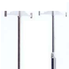
Infusionshaltestange, fix oder verstellbar