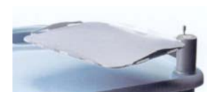
Schwenkbarer Gerätearm, feststellbar