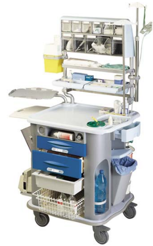
Notfall- und Intensivpflegewagen

(Alle Wagen ausgehend von einem Grundmodell frei konfigurierbar!)