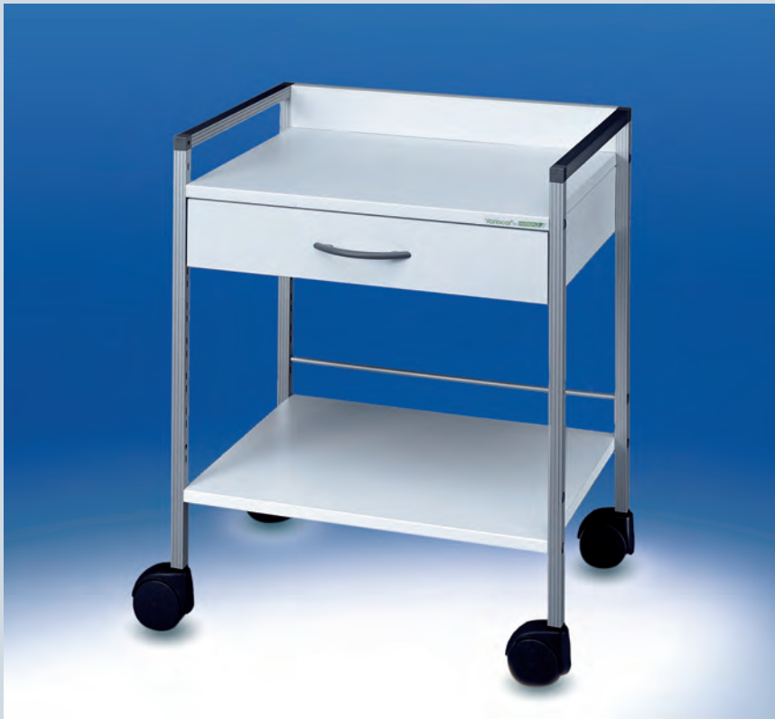
Variocar® Viva 73 cm hoch ► Ref.-Nr. 15585

Das patentierte Rastersystem für modulare Kombinationsmöglichkeiten, glatte, klare Flächen und alle Vorzüge des Variocar®-Programmes machen das Viva-Serie zum trendigen Highlight.