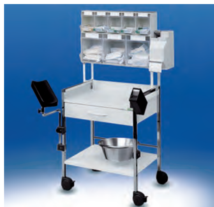
Variocar® 60 Injektionswagen PicBox-Plus ▶ Ref.-Nr. 05353