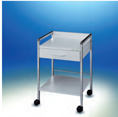
Variocar® 45 Basiswagen ► Ref.-Nr. 15609