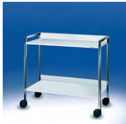
Variocar® 90 Regalwagen ▶ Ref.-Nr. 04509