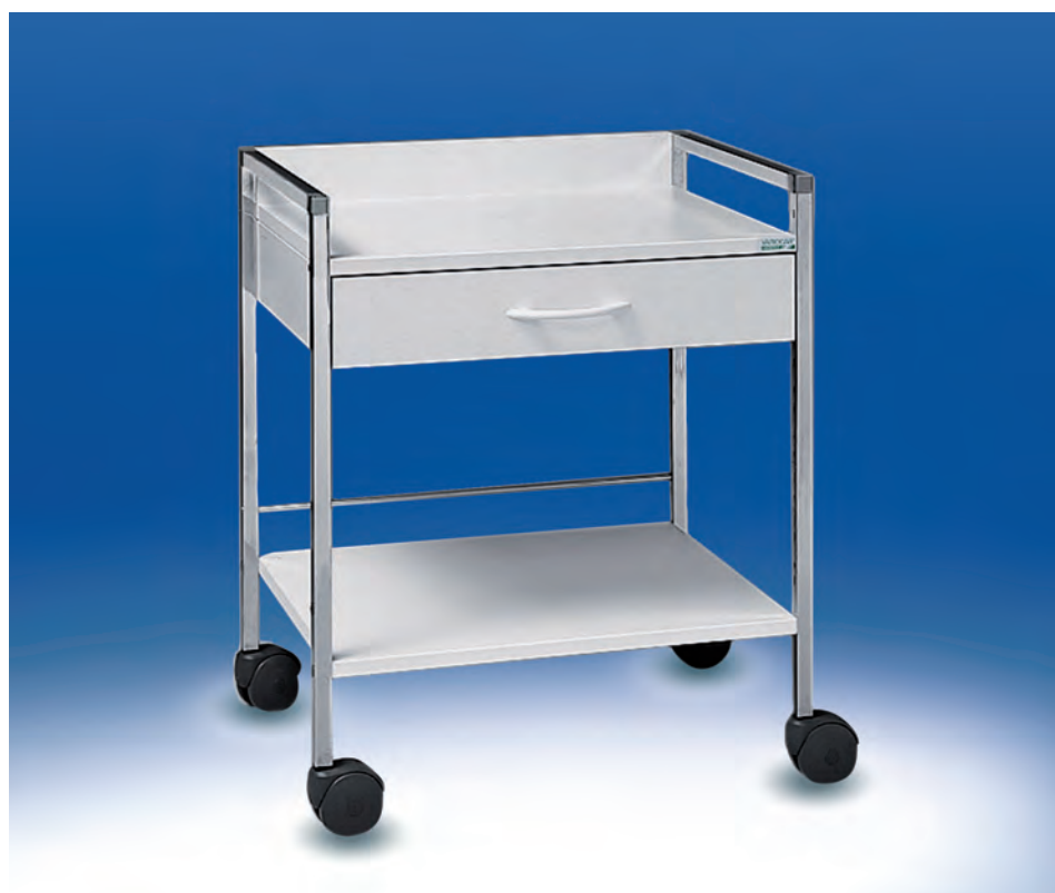
Variocar® 60 Basiswagen ▶ Ref.-Nr. 08069