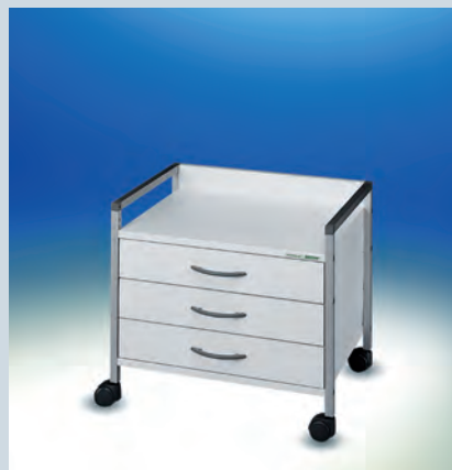
Variocar® Viva 52 cm hoch ► Ref.-Nr. 15597