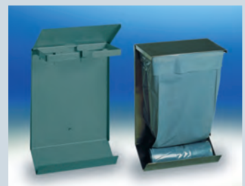
Piccolo Abfallsammler ► Ref.-Nr. 07873

Weitere Zubehörteile finden Sie in der Variocar®-Preisliste.