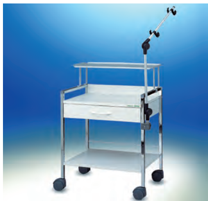
Variocar® 60 Ergometriewagen ▶ Ref.-Nr. 05443