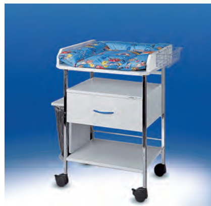
Variocar® 60 Wickelwagen ▶ Ref.-Nr. 14834