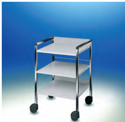
Variocar® 45 Regalwagen ▶ Ref.-Nr. 14515