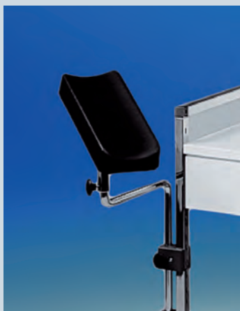
Armauflage ► Ref.-Nr. 09496