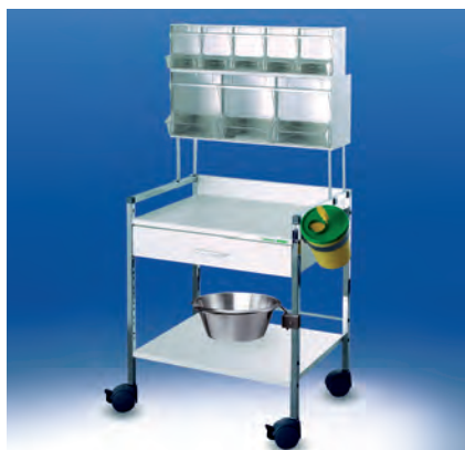
Variocar® 60 Injektionswagen PicBox ▶ Ref.-Nr. 05352