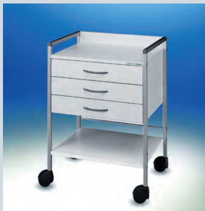
Variocar® Viva 83 cm hoch ► Ref.-Nr. 15592