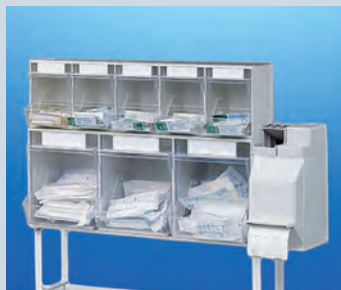
Injektionsset PicBox®Plus ► Ref.-Nr. 11377