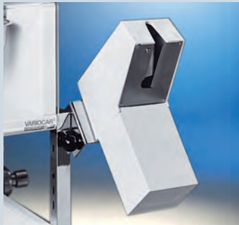
Ampullenöffner CUPFIX ► Ref.-Nr. 05771