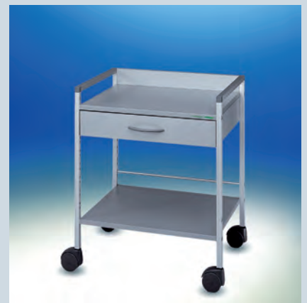
Variocar® Viva titan 73 cm hoch ► Ref.-Nr. 15630