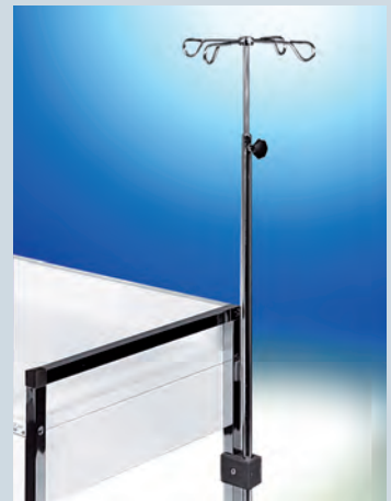
Infusionsflaschenhalter ► Ref.-Nr. 04621