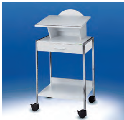
Variocar® 60 Stehschreibpult ▶ Ref.-Nr. 15584