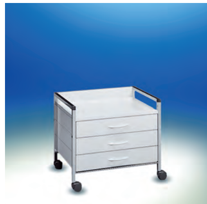
Variocar® 60 Unterfahrwagen ► Ref.-Nr. 08054