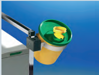
Medi-Müll Entsorgungsboxen 1,5 L Set mit 20 Boxen und Variocar-Halterung ► Ref.-Nr. 04778