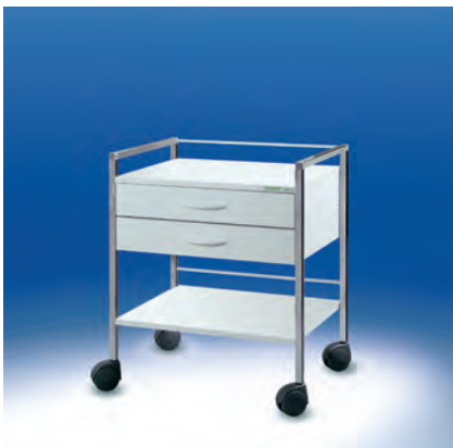
Variocar® 60 Basiswagen ► Ref.-Nr. 08087