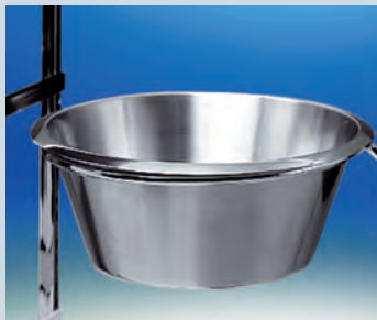
Abwurf mit Schale aus Chromnickelstahl ► Ref.-Nr. 04615