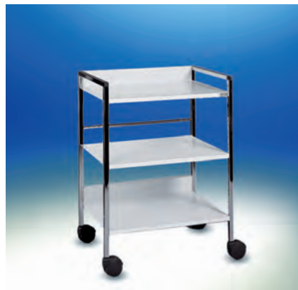
Variocar® 60 Regalwagen ▶ Ref.-Nr. 05622