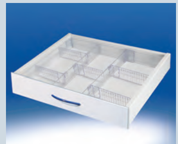
Schubladeneinsatz 60 ► Ref.-Nr. 16723 Schubladeneinsatz 45 ► Ref.-Nr. 16724