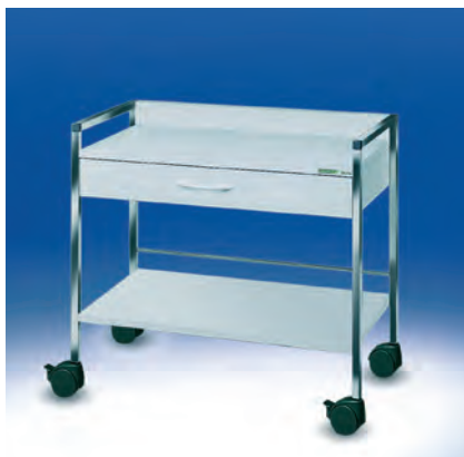
Variocar® 90 Basiswagen ► Ref.-Nr. 04511