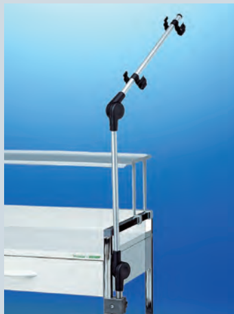
Kabel- und Schlauchhalter ► Ref.-Nr. 10265