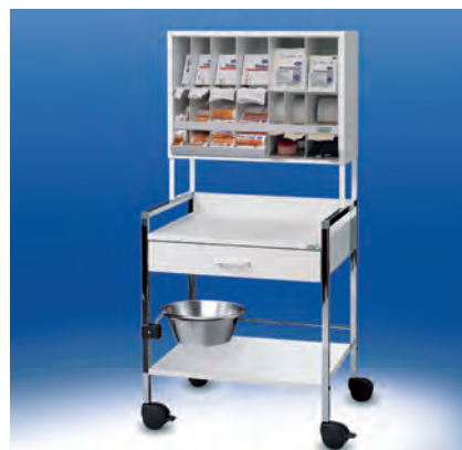
Variocar® 60 Behandlungswagen COMPACT ▶ Ref.-Nr. 05351