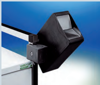
Schluckfix-Set mit 20 Boxen und Variocar-Halterung ► Ref.-Nr. 09498