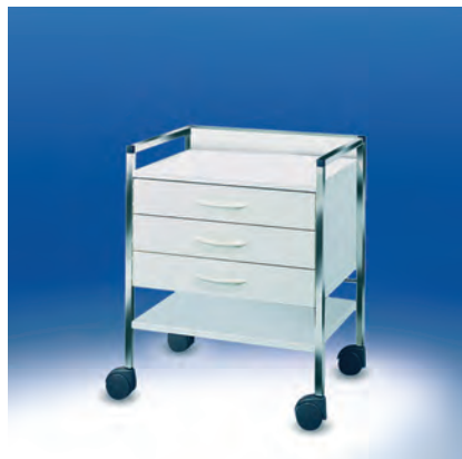
Variocar® 60 Basiswagen ► Ref.-Nr. 08075