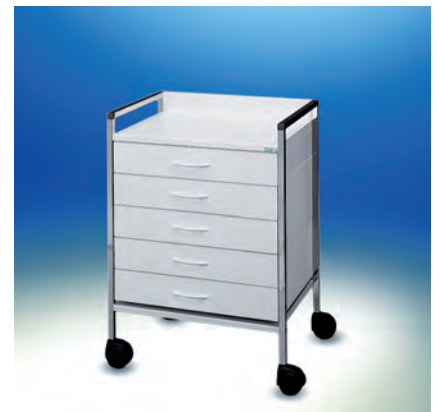
Variocar® 60 Basiswagen ► Ref.-Nr. 08096