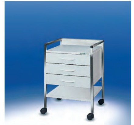
Variocar® 45 Basiswagen ► Ref.-Nr. 16372