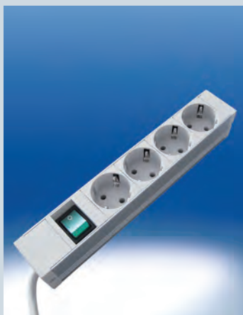
Steckdosenleiste 4-fach ► Ref.-Nr. 21692