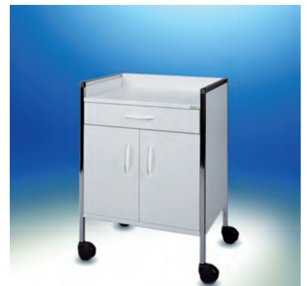
Variocar® 60 Schrankwagen ► Ref.-Nr. 04723